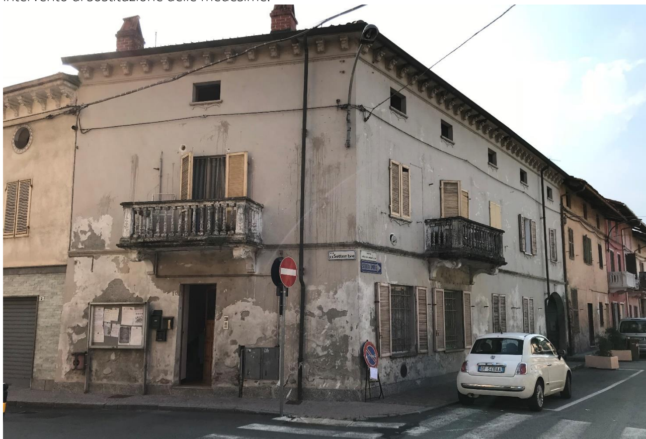
Figura 1 – Edificio oggetto d'intervento

Nei sopralluoghi effettuati a lavori in corso si è potuto inoltre notare come le persiane in oggetto in passato siano già state "invertite", ossia la faccia esterna della persiana sia stata capovolta e reinstallata verso il lato interno previo rimontaggio dei cardini, probabilmente per cercare di rispondere alle problematiche causate dal legno marcio. Considerate le pessime condizioni in cui versano oggi le persiane e vista anche la difficoltà nel capovolgere le persiane, si è reso necessario un intervento di sostituzione delle medesime.