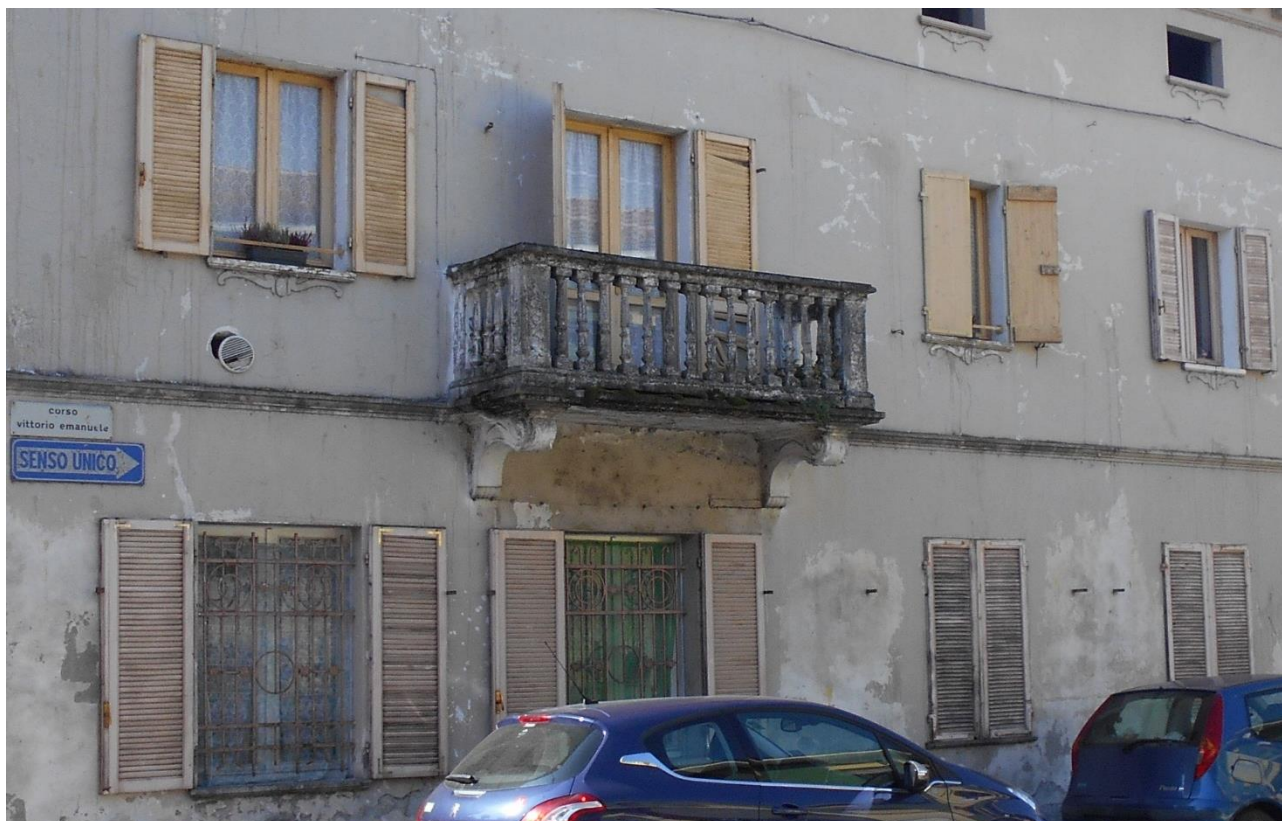
Figura 2 – Facciata nord